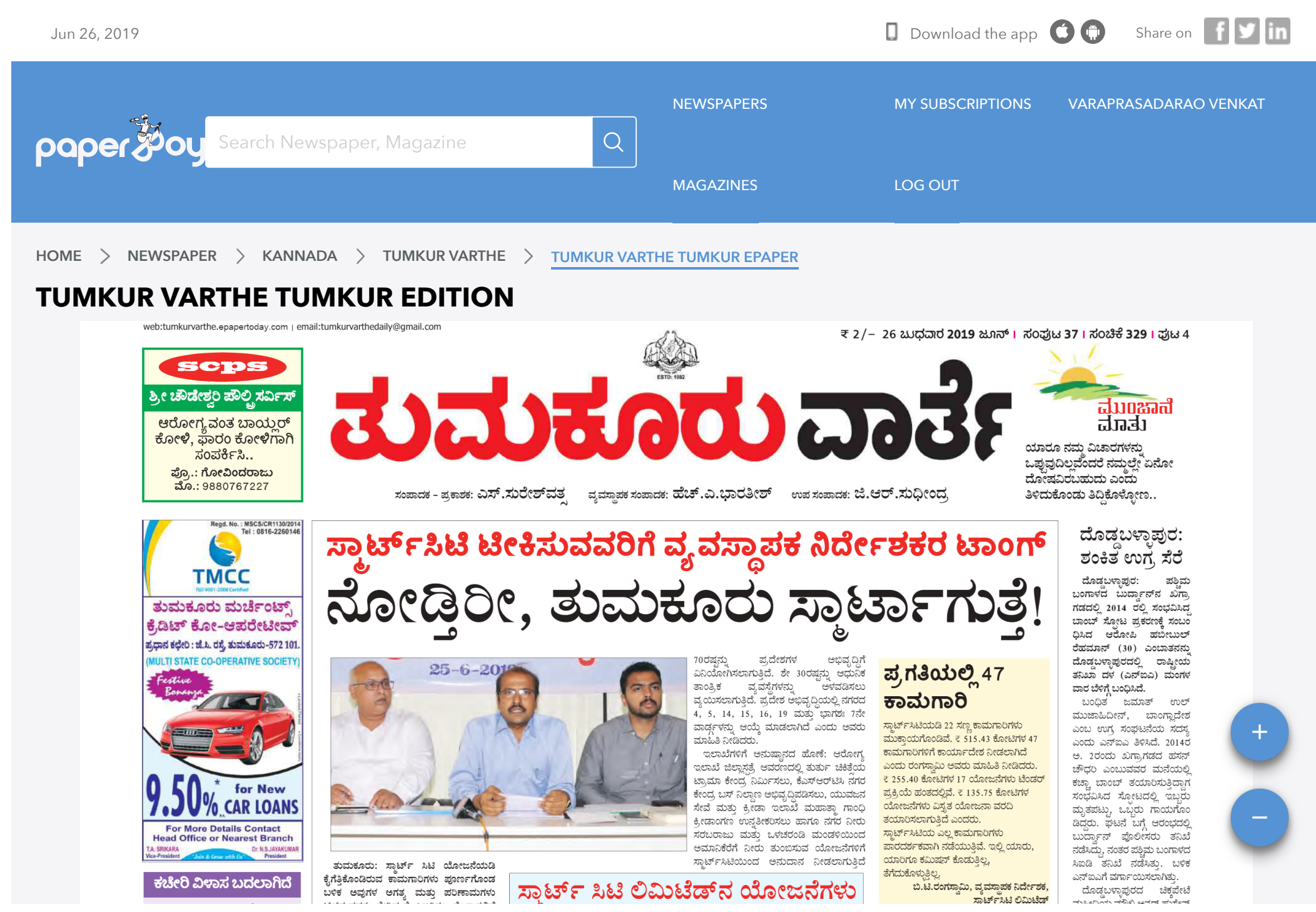
Tumkur Varthe Kannada Tumkur ePaper, Karnataka, Get Today eNewspaper on Web, Android & iOS